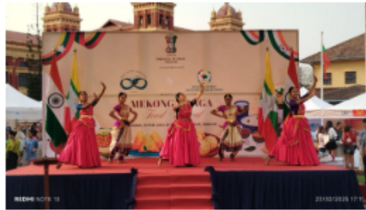
Dynamic scenes from the Mekong-Ganga Food Festival at the Secretariat Yangon on Theinbyu Road yesterday.

The Mekong-Ganga Cooperation (MGC) was formed by India and five ASEAN countries: Cambodia, Laos, Myanmar, Thailand, and Vietnam. One of the key activities of the MGC is promoting tourism through cultural exchanges.