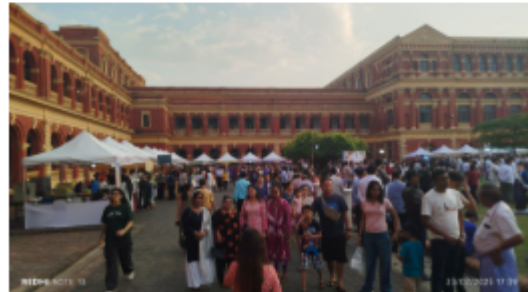
Dynamic scenes from the Mekong-Ganga Food Festival at the Secretariat Yangon on Theinbyu Road yesterday.

The Union minister also presented the performers with unique gifts and took a photo. Afterwards, the Union minister, the Yangon Region chief minister, and the ambassador cut the ribbon to officially open the festival. - MNA/TH