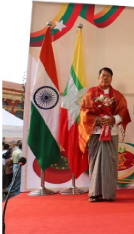
PUBLISHED 24 FEBRUARY 2025

ရန်ကုန်မြို့၊ သိမ်ဖြူလမ်းရှိ ဝန်ကြီးများရုံး The 5 ကို ဖေဖော်ဝါရီ ၂၃ ရက်၊ ညနေ ၅ နာရီက ပြုလုပ်