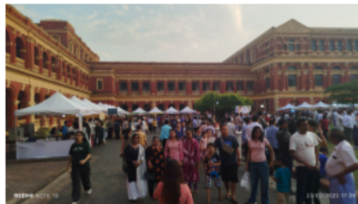
Dynamic scenes from the Mekong-Ganga Food Festival at the Secretariat Yangon on Theinbyu Road yesterday.

The Union minister also presented the performers with unique gifts and took a photo. Afterwards, the Union minister, the Yangon Region chief minister, and the ambassador cut the ribbon to officially open the festival. — MNA/TH