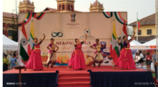
Dynamic scenes from the Mekong-Ganga Food Festival at the Secretariat Yangon on Theinbyu Road yesterday.

ထို့ပြင် အဆိုပါ အစားအစာ ယဉ်း ဖြစ်ကြောင်းသိရသည်။